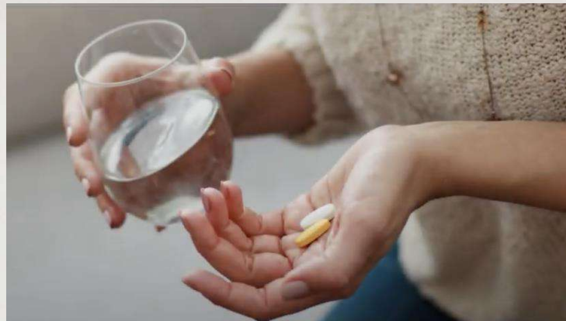
Commercial Voice Demo