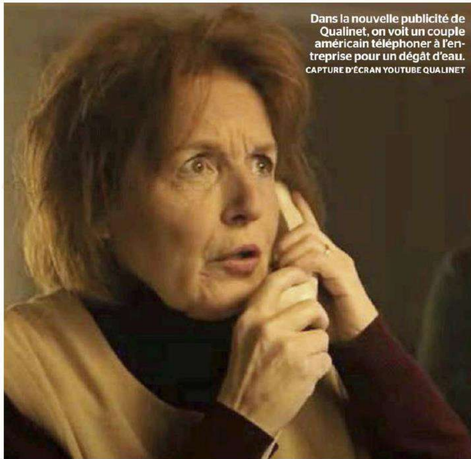
Dans la nouvelle publicité de Qualinet, on voit un couple américain téléphoner à l'entreprise pour un dégât d'eau.